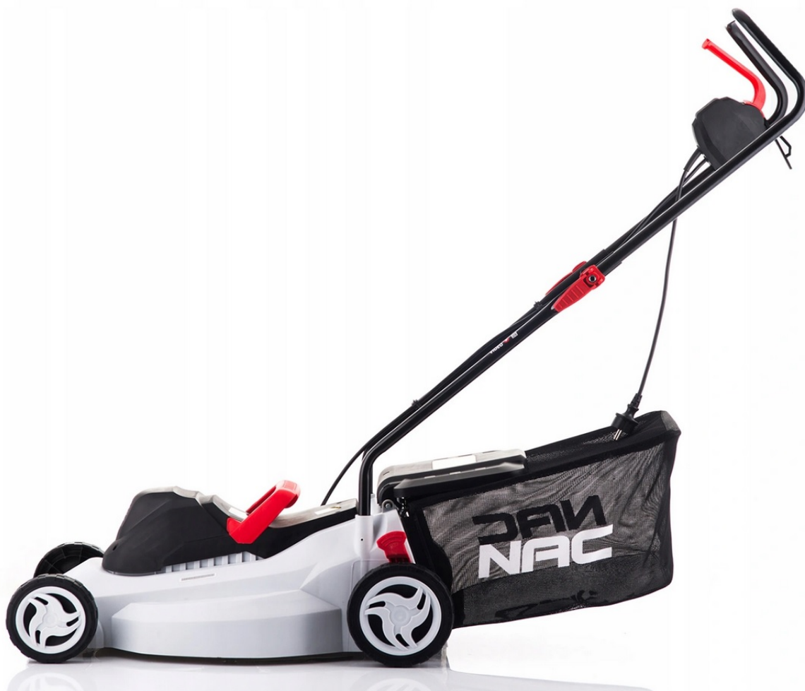
TONDEUSE ÉLECTRIQUE NAC LE18-40-PB-S