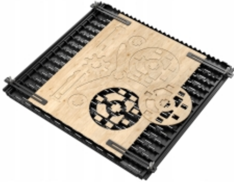
Table de travail pour le traceur laser Atomstack AF-3

Lien vers le produit : https://cncworld.fr/table-de-travail-pour-le-traceur-laser-atomstack-af-3-p-826.html