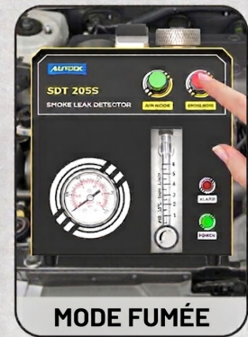
Générateur de fumée à contrôle indépendant