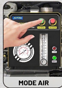
Pompe à air intégrée à contrôle indépendant