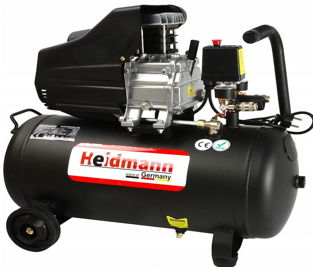
COMPRESSEUR D'HUILE 50L 8bar HEIDMANN H00721

L'un des compresseurs 50 litres les plus puissants disponibles sur le marché !