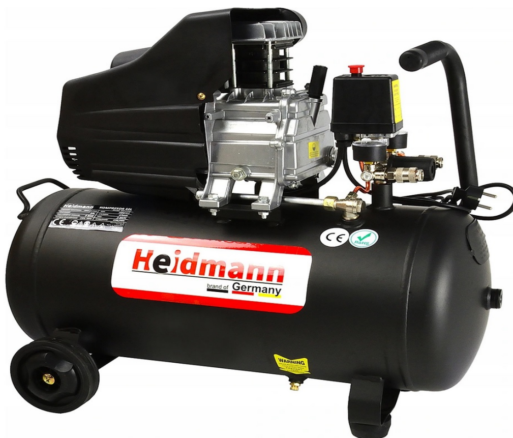
COMPRESSEUR D'HUILE 50L 8bar HEIDMANN H00721

L'un des compresseurs 50 litres les plus puissants disponibles sur le marché !